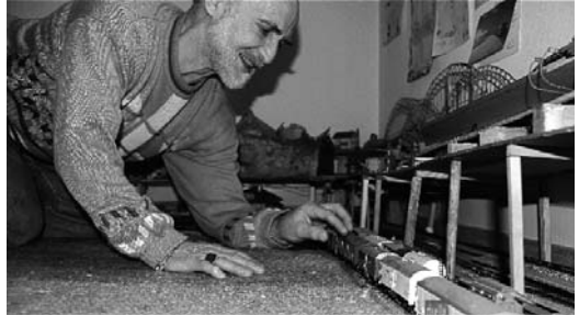
Das «Isebühmle» ist – neben dem Singen – seine grosse Leidenschaft.