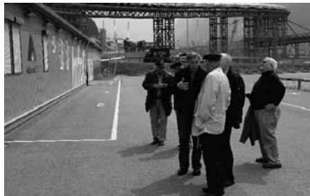
Auftakt zu spannenden Stunden in der AlpTransit-Kantine in Amsteg.

diversen Zahlen der Baustellen und Projekte zeigen. Im Anschluss daran verabschieden sich die Teilnehmer und begeben sich wieder auf den Heimweg.