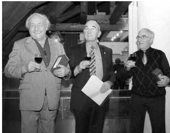
Der Präsident mit den beiden treuesten Sängern.