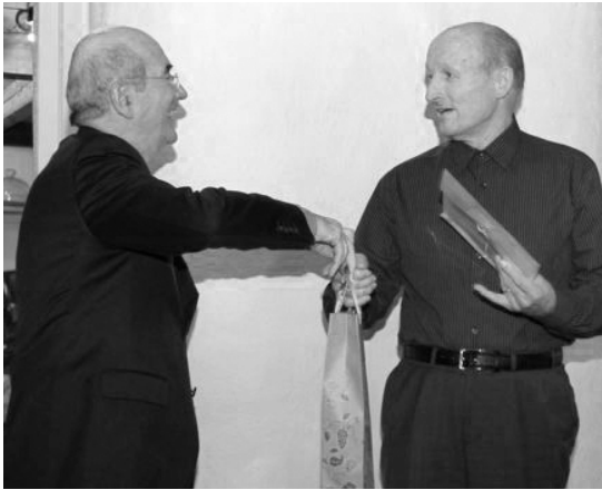
Dank an Roland Schmid.