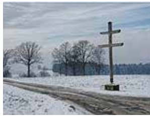
Nocolas um 1920