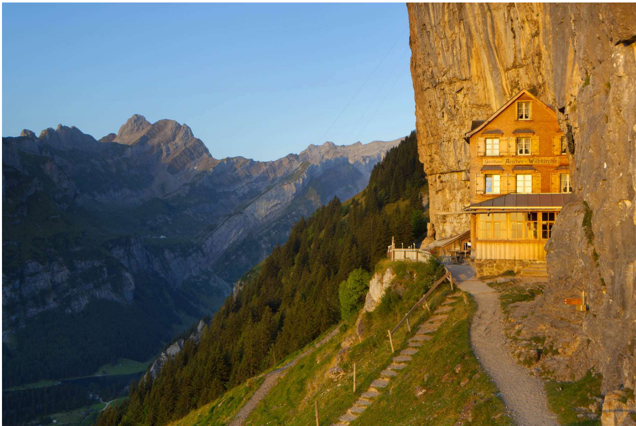
Berggasthaus Äscher Wildkirchli

Liebe Wanderfreunde, geschätzte Sängerkollegen, Nach den sieben erstmals unter der Ägide des Luzerner Chors erfolgreich durchgeführten Wanderwochen in Wildhaus, Adelboden, Flims, Scuol, Saignelégier, Saas-Grund und Mendrisio setzen wir auch dieses Jahr die Tradition fort.